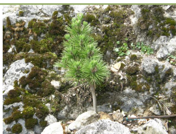
Sosna Thunberga 'Ben-Sho-Sho'

Spośród miniaturowych drzewek i krzewów liściastych najbardziej przydatne na skalniak są te, które urozmaicają jego kolorystykę, zwłaszcza jesienią. Do najpiękniejszych małych drzew należą niewątpliwie klony palmowe. Cenne są także wierzby, wiśnie, wawrzynki, miłorzęby, brzozy, wiązy i dęby.