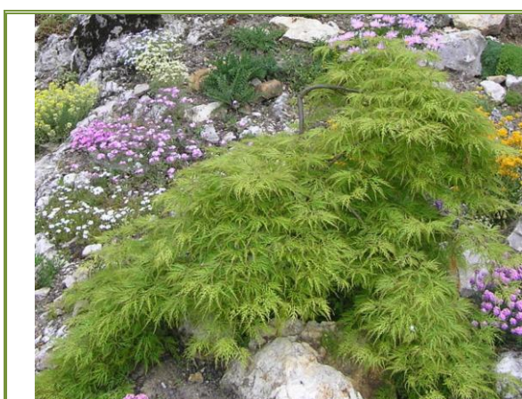
Klon palmowy 'Giseli'

W ostatnich latach w szkółkach, a także w amatorskich hodowlach pojawia się mnóstwo nowych odmian iglaków wyhodowanych z czarcich mioteł. Często są one do siebie tak podobne, że trudno je odróżnić.