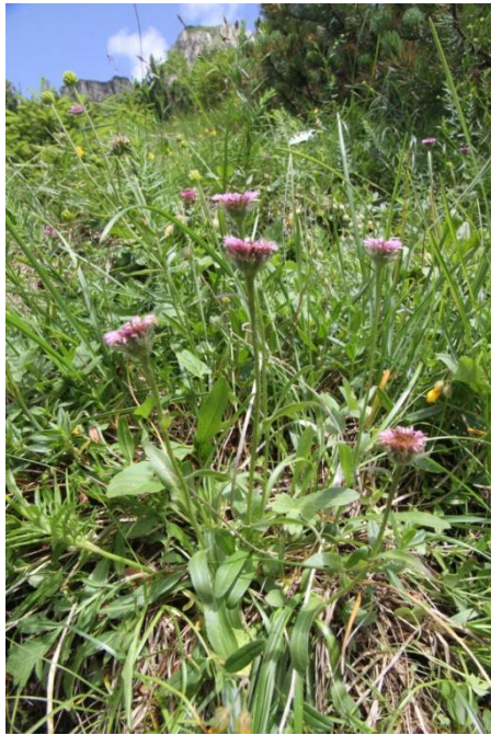
Nawapienna murawa wysokogórska

gatunkową i krajobrazową. W obrębie pięter reglowych tworzone są zbiorowiska naskalne z sasanką słowacką, pierwiosnkiem łyszczak i dębikiem ośmiopłatkowym, łąki z mieczykiem dachówkowatym i szafranem spiskim lub z ostrożniem łąkowym i rdestem węzownikiem, torfowisko wysokie z rosiczką okrągłolistną, żurawiną błotną i welniankami. Piętro kosodrzewiny urozmaicone jest ziołoroślami z miłosną górską, modrzykiem górskim, omiegiem górskim i tojadem mocnym. W piętrze hal obok dominujących łąk alpejskich ważnym elementem są zbiorowiska wyleżysk z sybaldią rozestaną, skalnicą naradkowatą i rogownicą raciborskiego. W najwyższym piętrze - turni - obok typowych muraw wysokogórskich z goryczką przezroczystą i starcem kraińskim miejsce swoje znajdują w naszym Ogrodzie zbiorowiska piargów z jaskrem lodnikowym, warzuchą tatrzańską i skalnicą darniową czy skalnicą tatrzańską.